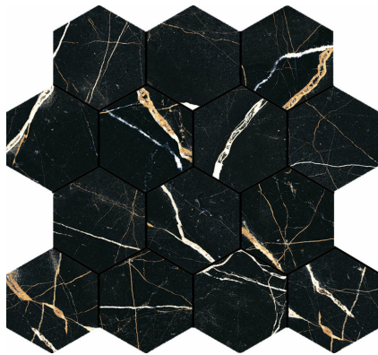
HEXA MOONLIGHT PULIDO TR-46