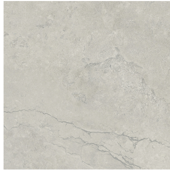
KRONOS SILVER RECTIFICADO PR6060R