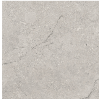
KRONOS TAUPE PR6060R