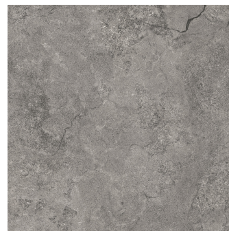
KRONOS DARK PR6060R