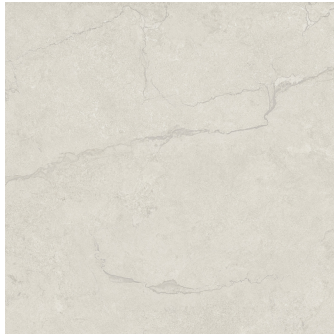
KRONOS SAND PR6060R