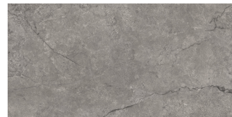
KRONOS DARK RECTIFICADO P6012RB