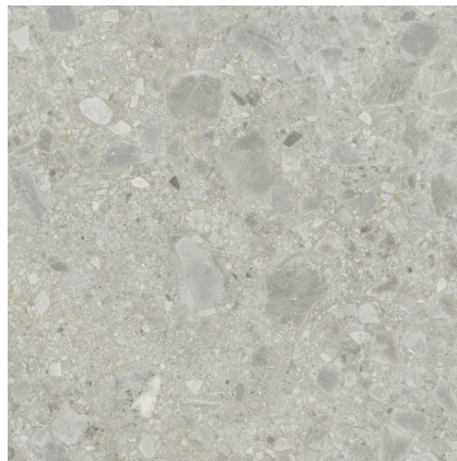
STONE HANNOVER STEEL ESP. RECT ANTI-SLIP PR8080BES