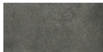
GRAFTON ANTHRACITE PR3060LB