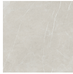
ETERNAL PEARL NATURAL PR8080L