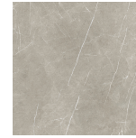
ETERNAL TAUPE PULIDO PR8080RP