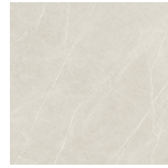
ETERNAL CREAM PULIDO PR8080P