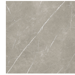
ETERNAL TAUPE NATURAL PR8080R