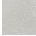
ETERNAL PEARL PULIDO PR8080P