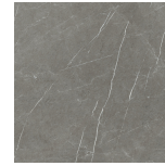
ETERNAL DARK NATURAL PR8080R