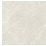
ETERNAL CREAM NATURAL PR8080L