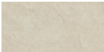
CREAM CHAMBER NATURAL P6012L