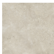
CAPITAL BEIGE RECTIFICADO PR8080L