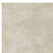
CAPITAL BEIGE ANTI-SLIP PR8080R