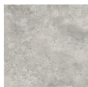
CAPITAL PERLA PR8080L