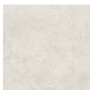
CAPITAL BLANCO ANTI-SLIP PR8080R