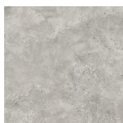
CAPITAL PERLA ANTI-SLIP PR8080R