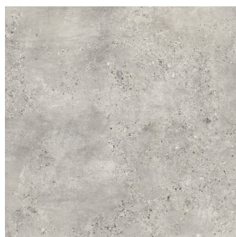
CAPITAL PERLA PR6060L