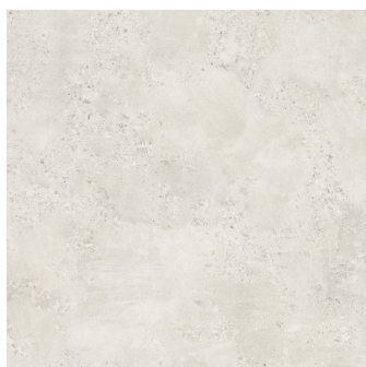
CAPITAL BLANCO PR6060L