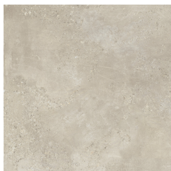
CAPITAL BEIGE PR6060L