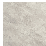
CANYON GREY ANTI-SLIP PR8080RB