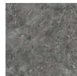
CANYON BLACK ANTI-SLIP PR8080RE