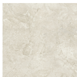
CANYON BONE ANTI-SLIP PR8080RB