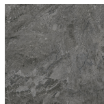
CANYON BLACK PR8080RE