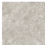
CANYON GREY PR8080RB