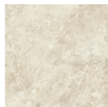
CANYON BEIGE ANTI-SLIP PR8080RB