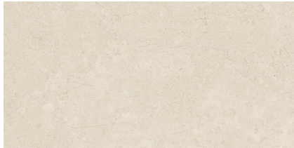
BELSTONE CREAM P6012LB