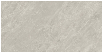
BALMORAL MOON NATURAL P8016R