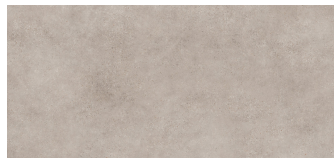
ASPHALT MUD BP2612E