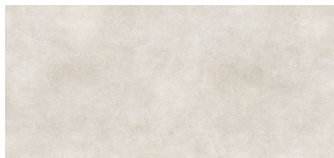
ASPHALT OFF WHITE BP2612L