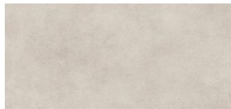
ASPHALT GRIT BP2612L