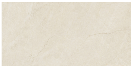
SORRENTO SABBIA PULIDO RECTIFICADO P8016P