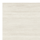
RAVELLO NATURALE P1212LB