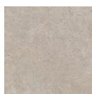
SALERNO BRONZO P1212LB