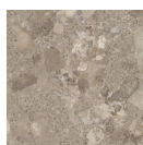
POSITANO BRONZO P1212RB