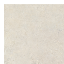
SALERNO AVORIO ANTI-SLIP P1212R