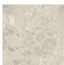
POSITANO AVORIO P1212RB