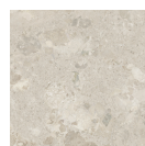
POSITANO AVORIO ANTI-SLIP P1212RB